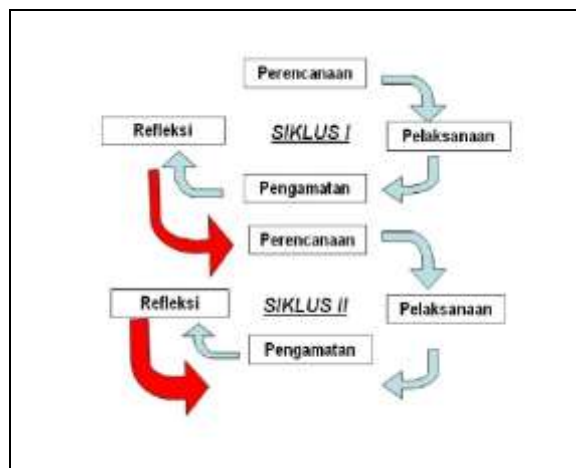
Gambar 1. Alur PTK Kemmis & Mc. Tanggart

PTK merupakan suatu bentuk kegiatan penelitian yang dilakukan oleh pendidik di lingkungan kelas melalui serangkaian siklus tindakan/ action . Secara umum, penelitian tindakan kelas terdiri dari 4 tahapan yakni: perencanaan, pelaksanaan, pengamatan & refleksi.